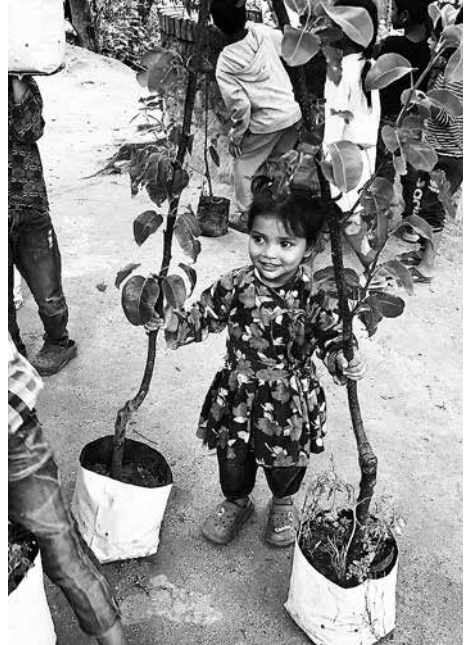
Auch die Kleinen helfen mit!

Armen immer wieder Grund zur Hoffnung. Sie schenken ihnen Lebensmut und zugleich Lebensfreude. Dabei war es ganz wichtig für die Menschen, dass wir zuverlässig wiederkamen.