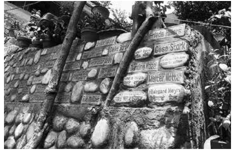
Mauer mit Namenssteinen derjenigen, für die die Obstbäume gepflanzt wurden